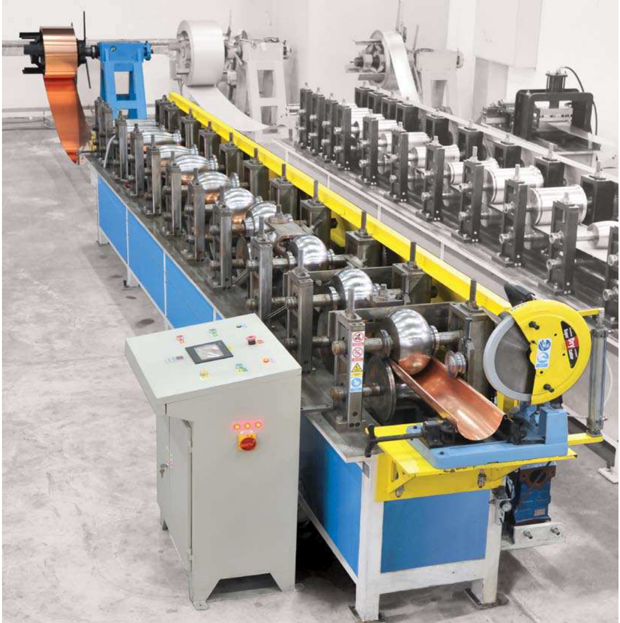
Linija za izradu polukružnog horizontalnog luka HOR 80